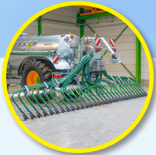
Pendislide BASIC 75/30PS1 Schleppschuhverteiler