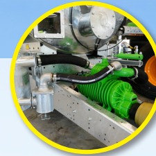
Pumpe 11 000 l/min • Ecopump • Ventil Ø 150 mm