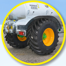
Radkasteneinbau: Bereifung 800/65R32